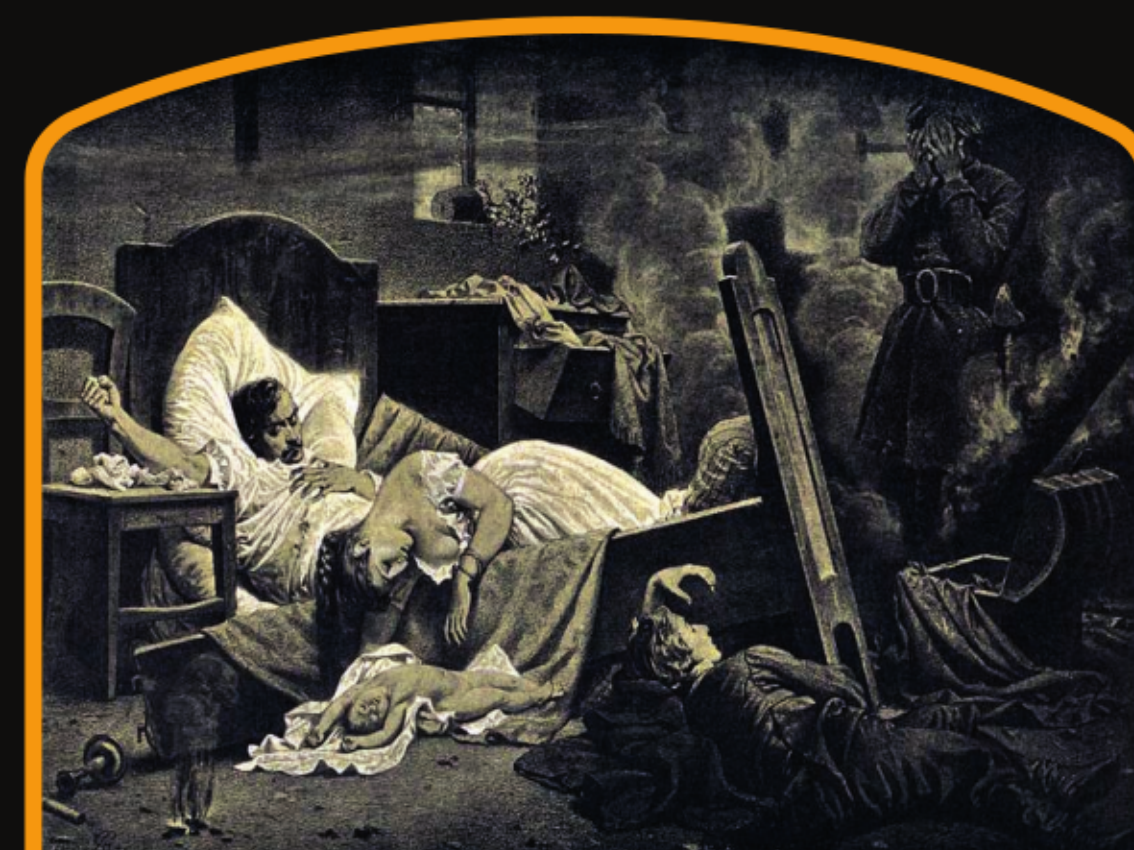
Po odejściu wroga